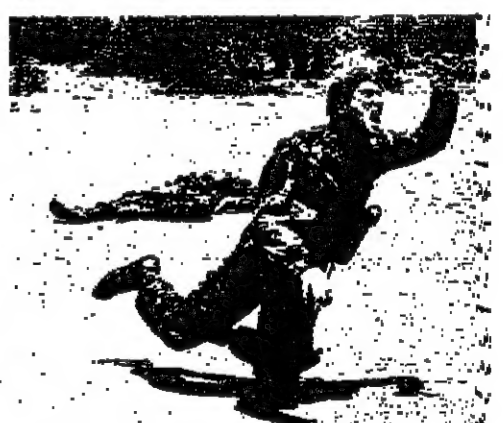
الرصاص يصد المرتزة .. ويصيب المثلث

من هو ريتشارد هاريس ولد ريتشارد هاريس في ايرلندا سنة 1927 وتما على تربية دينية مهيبة ثم التحق بكلية كاثوليكية في لندن حيث اطلق في دربه المصعب في العام 1956 ، بعد تومسة مدة فسي المسرح البريطاني . وقد بدأت شهرته في الانتاج منذ تجاع فيلم « مدافع الكاثولون » ، حيث لعب دورا في منتهى الصعوبة تعلق في لجه ، على غرار الافلام الدولية التي تصعد المخابرات مثل « ابطال تيليكا » و « مايجر داندي » و « الثوراة » و « نواز بيكي » و « رجل اسمه حصان »